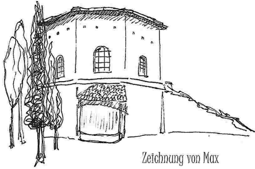
Zeichnung von Max

Man baut im Leben viele Brücken, manche aus Stein, manche aus Gedanken und Liebe. Die wertvollsten aber hinterlässt man in den Herzen der Menschen.